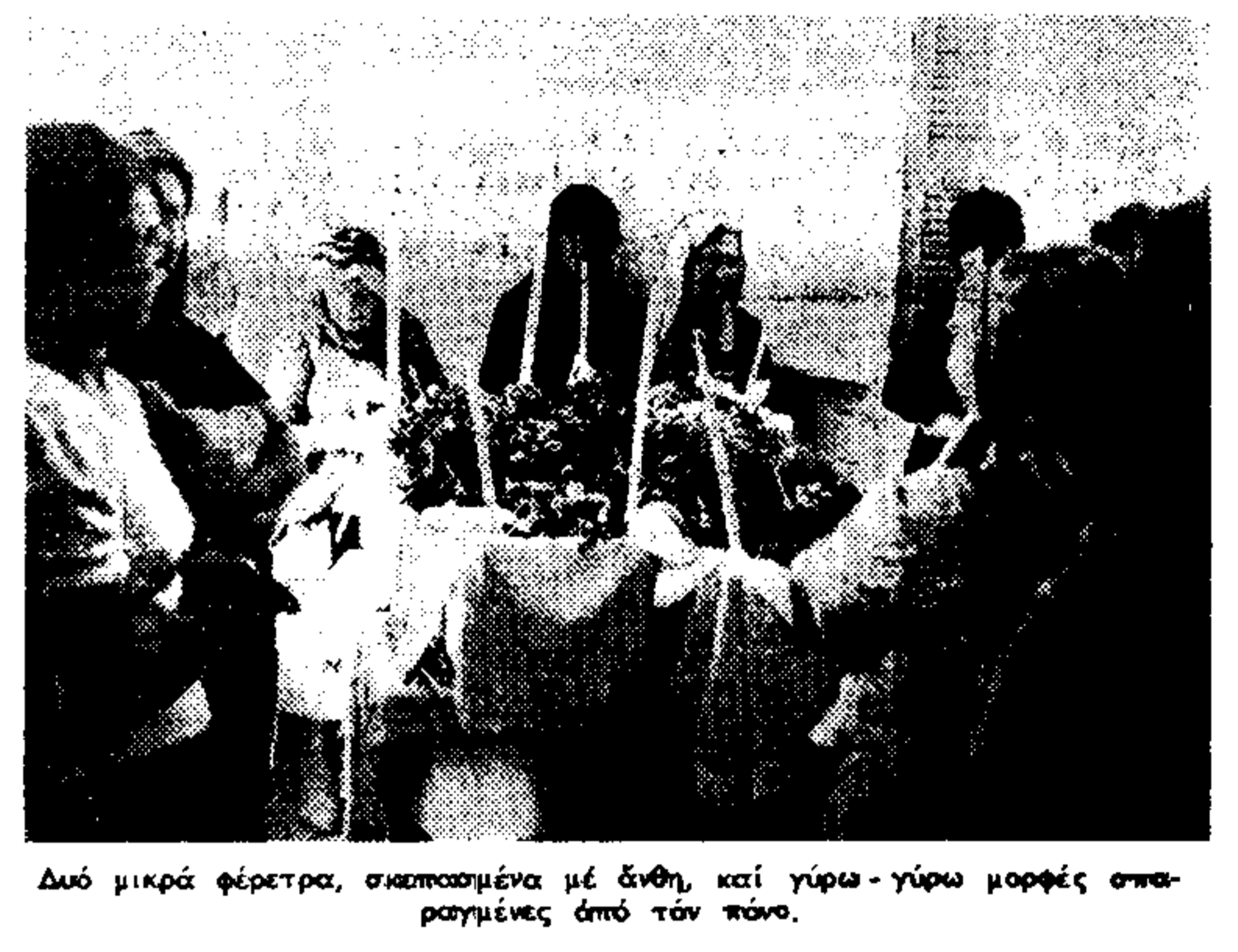
Δυὸ μικρὰ φέρετρα, συμπαιγμένα μετ' ἀλλήλων, καὶ γύρω-γύρω κομμάτια σπαρταρισμένα ἀπὸ τὸν πόνον.